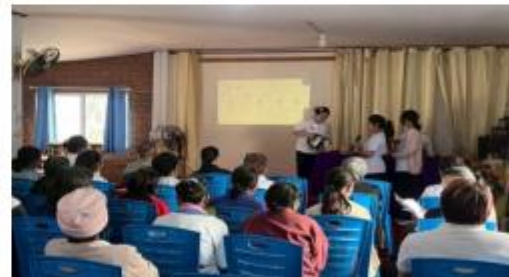
(กิจกรรมให้ความรู้วันฉัตรกรรมชา่อู่หลงผสมซานจา)