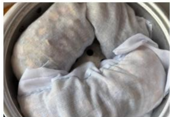
(นวัตกรรมหมอนสมุนไพรประคบจุด)