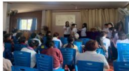
(กิจกรรมให้ความรู้วันฉัตรกรรมหอมสมุนไพรประคบจุด)