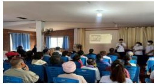
(กิจกรรมให้ความรู้เรื่องความดันโลหิตสูง)