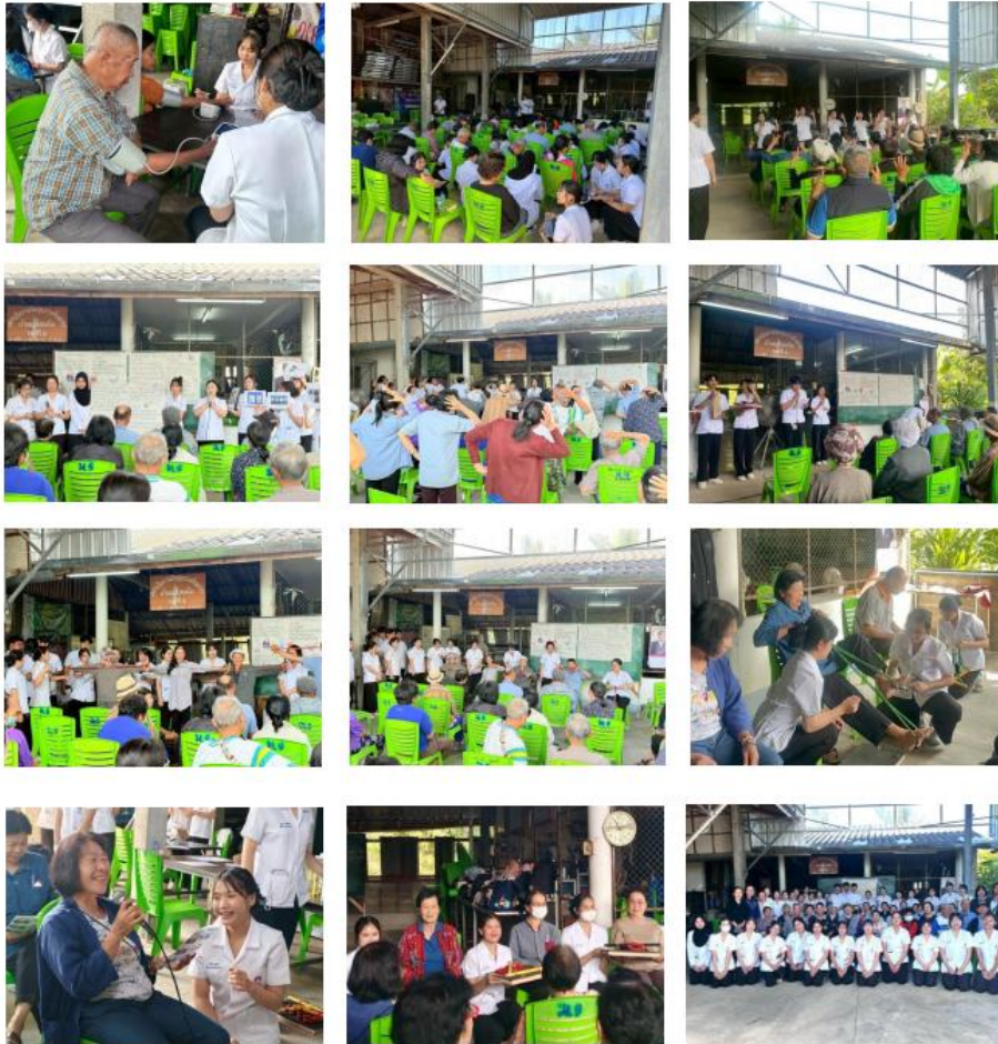
รูปภาพกิจกรรม