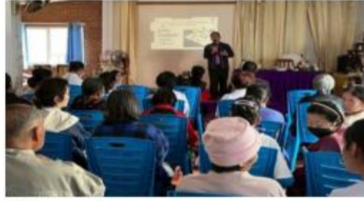
(ผู้ใหญ่บ้านกล่าวเปิดโครงการ)