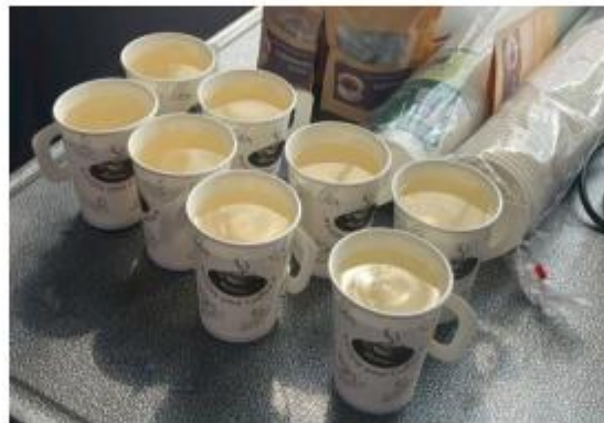
(นวัตกรรมชาอู่หลงผสมชาเขียว)